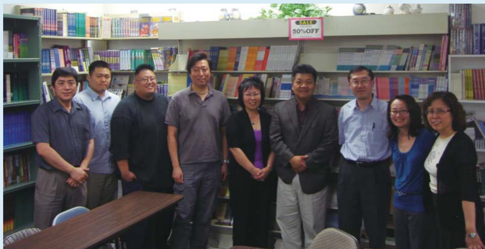
▲本院同工和ISAAC機構、傳揚雜誌英文版同工，以及洛福英語堂牧師在一次腦力激盪會議後的合影。盼望結合多方資源，可以在亞美事工和第二代事工有新的突破。 The coworkers of Logos, ISAAC, Inheritance Magazine, and EFCLA English Pastor. The picture was taken after a joint ministry brainstorming meeting.

可能性。終於在2007年成立「台灣正道福音神學院」。預計在2010年校區從中壢搬遷到台北關渡後，將可吸引更多蒙召者來接受裝備。