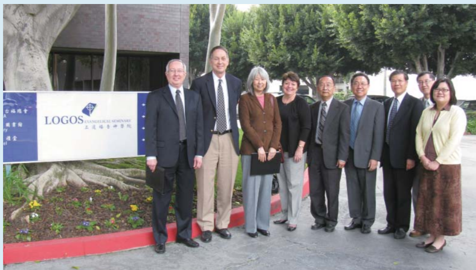
▲2009年2月美西大專院校協會首度來校訪察，對本院整體教學環境與成效給予高度正面評價。 WASC Committee's first site visit in Feb, 2009